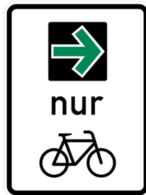
VZ 721 (Grünpfeil mit Beschränkung auf den Radverkehr)